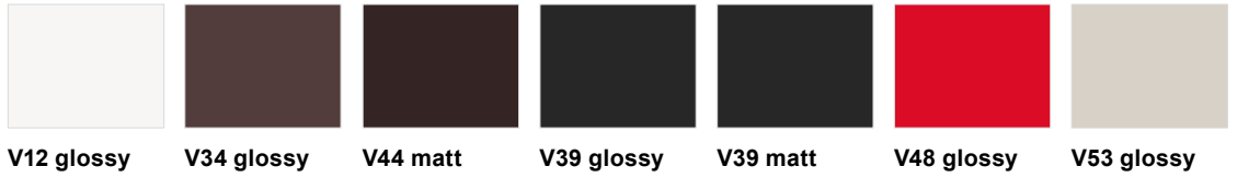
V12 glossy V34 glossy V44 matt V39 glossy V39 matt V48 glossy V53 glossy