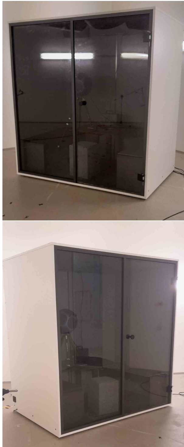
Abbildung 1: Meetingkabine Berlin Acoustics Meet