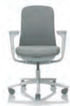
HÅG SoFi 7200 mit gepolsterter Lehne**