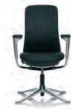
HÅG SoFi 7302 mit Stoff Polerat Exclusive*