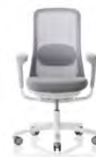
HÅG SoFi 7500 mit hellgrauem Netzbezug**