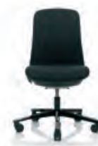
HÅG SoFi 7302 mit gepolsterter Lehne*