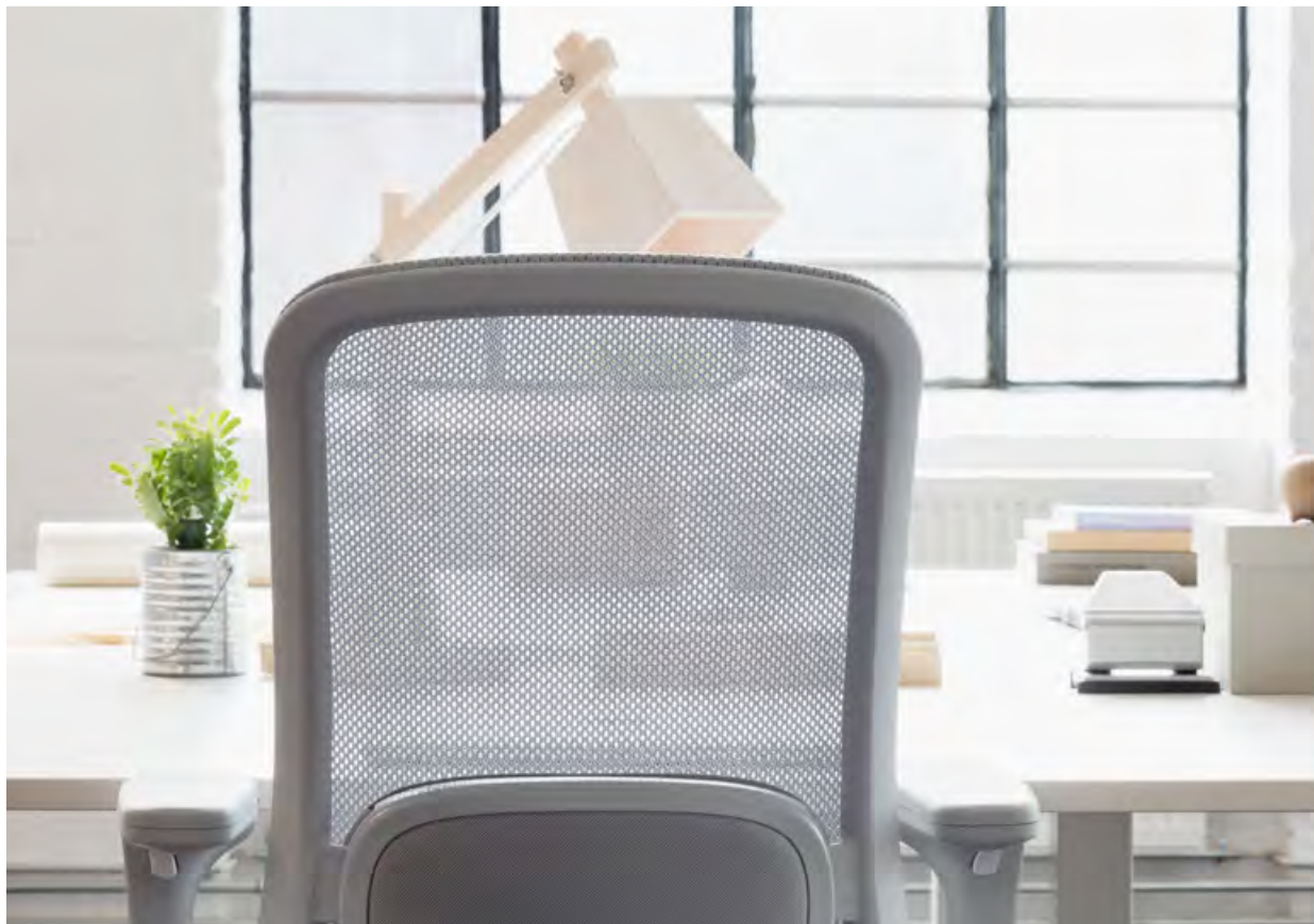
HÅG SoFi mesh in MEH002 Mesh hellgrau mit Stoffbezug Nexus Pewter 01 von Camira