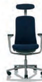
HÅG SoFi 7300 mit gepolsterter Lehne und Kopfstütze