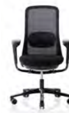
HÅG SoFi 7500 mit schwarzem Netzbezug**