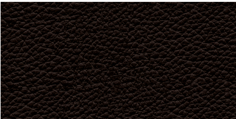
czarny/ schwarz/ black