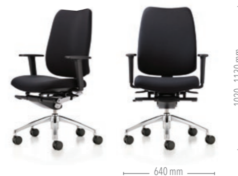
Mit hoher Rückenlehne und dynamischer Synchronmechanik