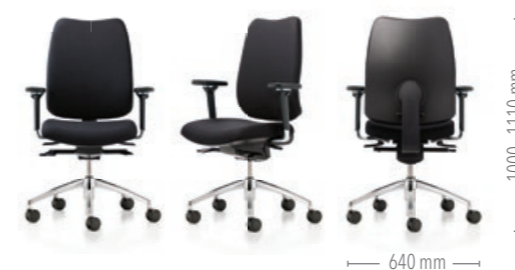
feeling light mit Synchronmechanik und Rückenstab aus Kunststoff