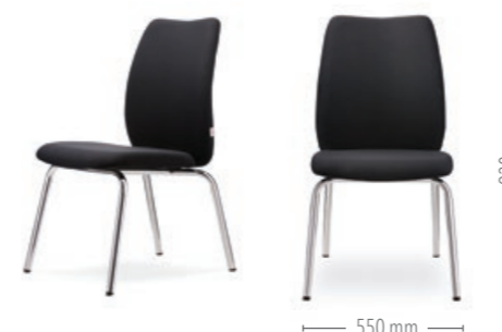
Vierbeinstuhl ohne Armlehnen