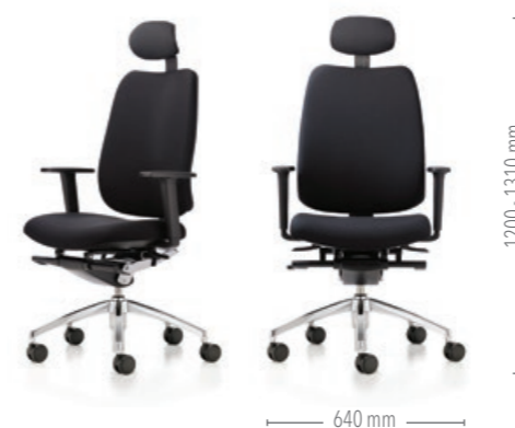
Mit hoher Rückenlehne, Kopfstütze und dynamischer Synchronmechanik