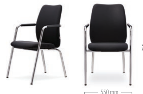
Vierbeinstuhl mit Armlehnen