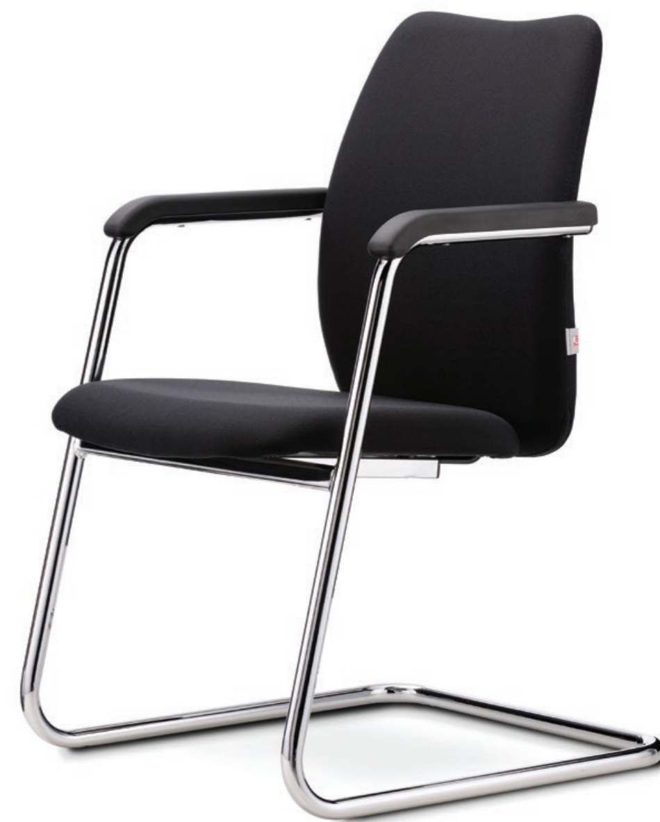
Abbildung mit PU-Armauflagen

Auch in stapelbarer Ausführung erhältlich.