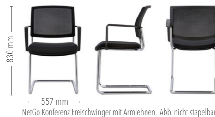
NetGo Konferenz Freischwinger mit Armlehnen, Abb. nicht stapelbar