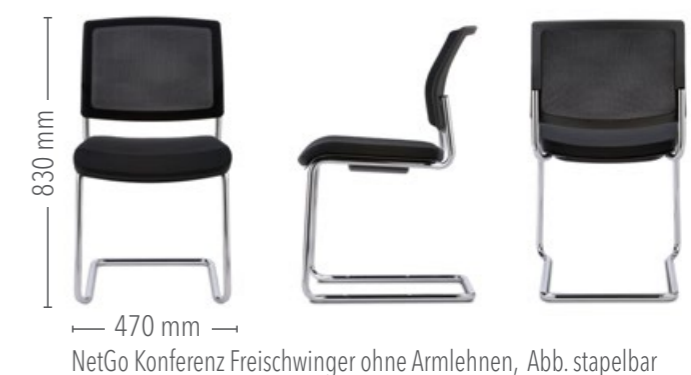
NetGo Konferenz Freischwinger ohne Armlehnen, Abb. stapelbar