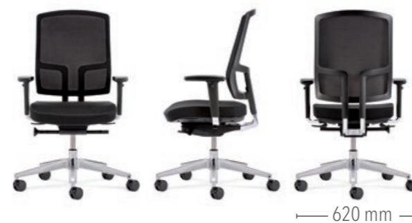
Mit Sitztiefenverstellung und Multifunktionsarmlehnen (3D) Gestell in Aluminium poliert