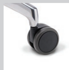
Rollen weich (für harte Böden)