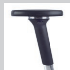
4D Multifunktionsarmlehne NPR