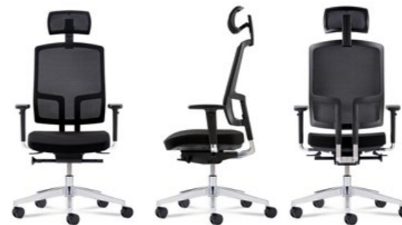
Wahlweise mit Kopfstütze erhältlich