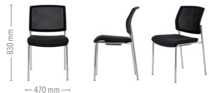
Vierfuß Konferenz ohne Armlehnen