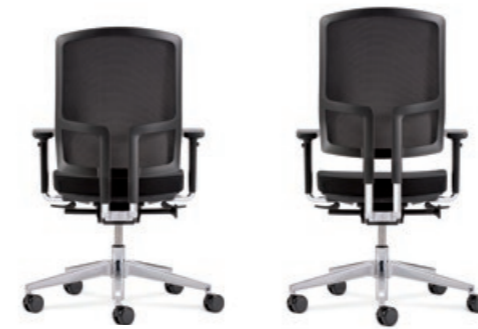
Der Verstellbereich des Netzurückens beträgt 70 mm. Rückenstab aus Aluminium poliert