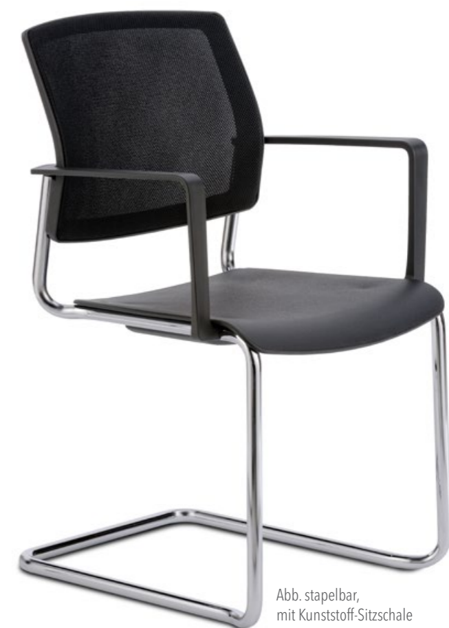
Abb. stapelbar, mit Kunststoff-Sitzschale

Alle Stühle aus dem NetGo-Konferenz-Programm sind auch ohne Polster mit einer stabilen Kunststoff-Sitzschale erhältlich.