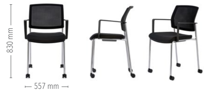
Vierfuß Konferenz mit Rollen