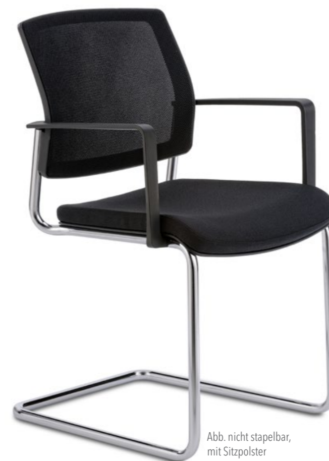
Abb. nicht stapelbar, mit Sitzpolster