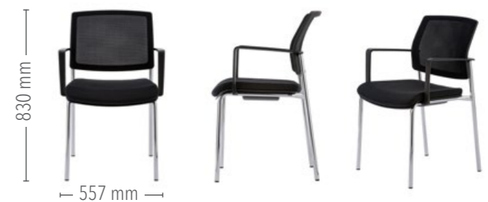
Vierfuß Konferenz, mit Armlehnen

Für den robusten Einsatz ist der Vierfuß Konferenz auch ohne Polster mit einer Kunststoff-Sitzschale erhältlich.