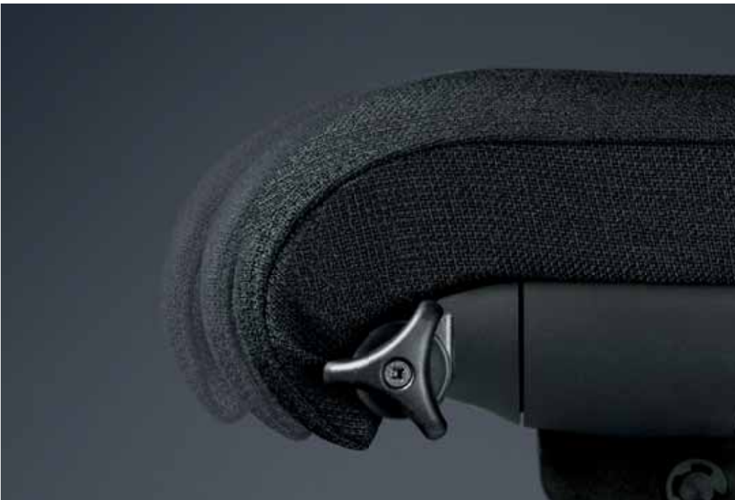
Die Astiv-Sitztiefeverstellung verlängert effektiv die Sitzfläche und somit die Auflagefläche für die Oberschenkel. Der Abstützpunkt des Rückens an der Lehne bleibt unverändert.