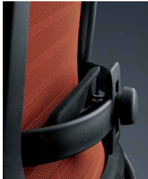
Höhen- und tiefenverstellbare, mechanische Lordosenstütze der Netz-Ausführung