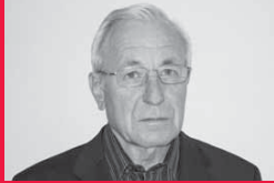
Produkt-Design: Gerhard Reichert, Eckard Hansen © interstuhl.

"Design entsteht originär mit dem Konzept, die Idee schafft die Differenz. Das Prinzip ist Minimalismus. Übertragen auf unser Projekt Hero ist das die Ergonomie in Verbindung mit einer einfachen Handhabung.