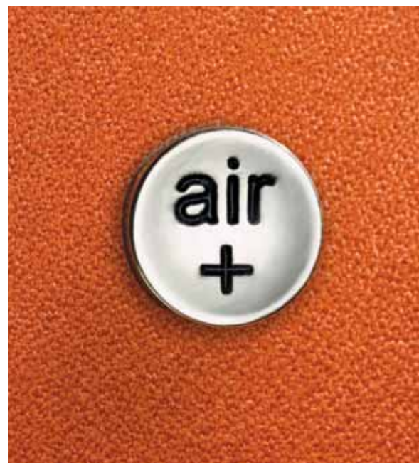
Höhen- und tiefenverstellbare Air-Pressure-Lordosenstütze der Polster-Ausführung