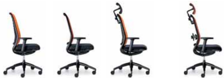
162H Drehstuhl mittelhoch, Rücken gepolstert, Armlehnen opt. 172H Drehstuhl mittelhoch, Rücken netzbespannt, Armlehnen opt. 265H Drehsessel, Rücken gepolstert, Kopfstütze, Armlehnen opt. 275H Drehsessel, Rücken netzbespannt, Kopfstütze, Armlehnen opt.