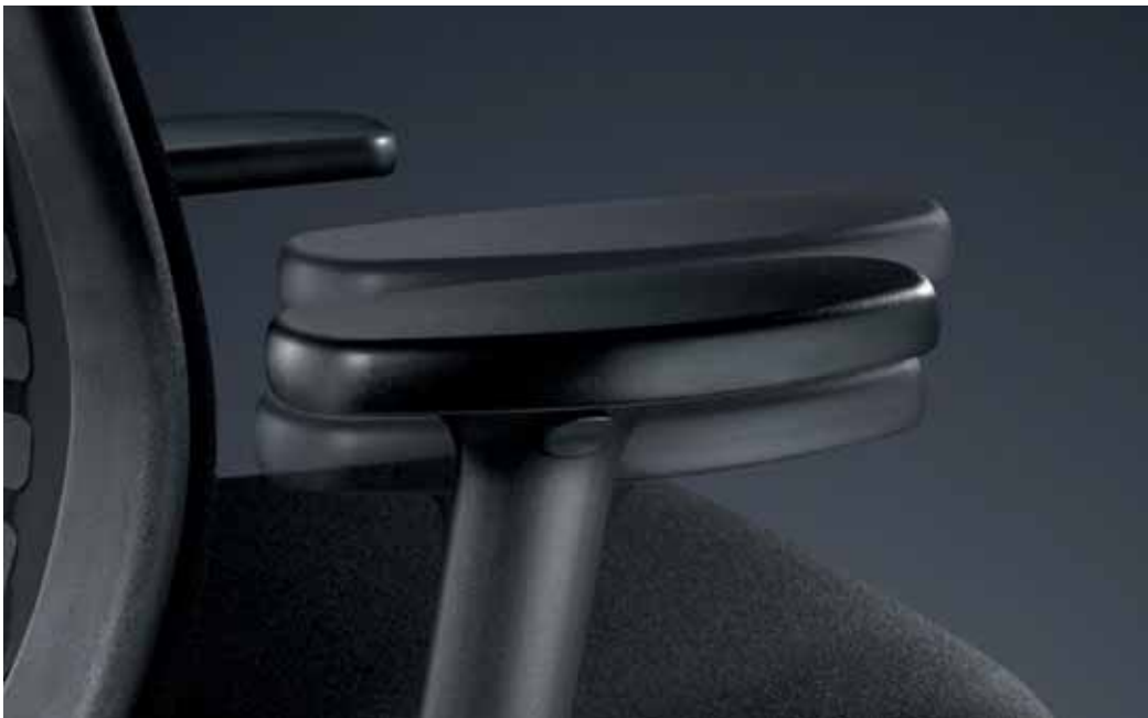
T-Armlehne, 4D verstellbar in Höhe, Breite, Tiefe, schwenkbar