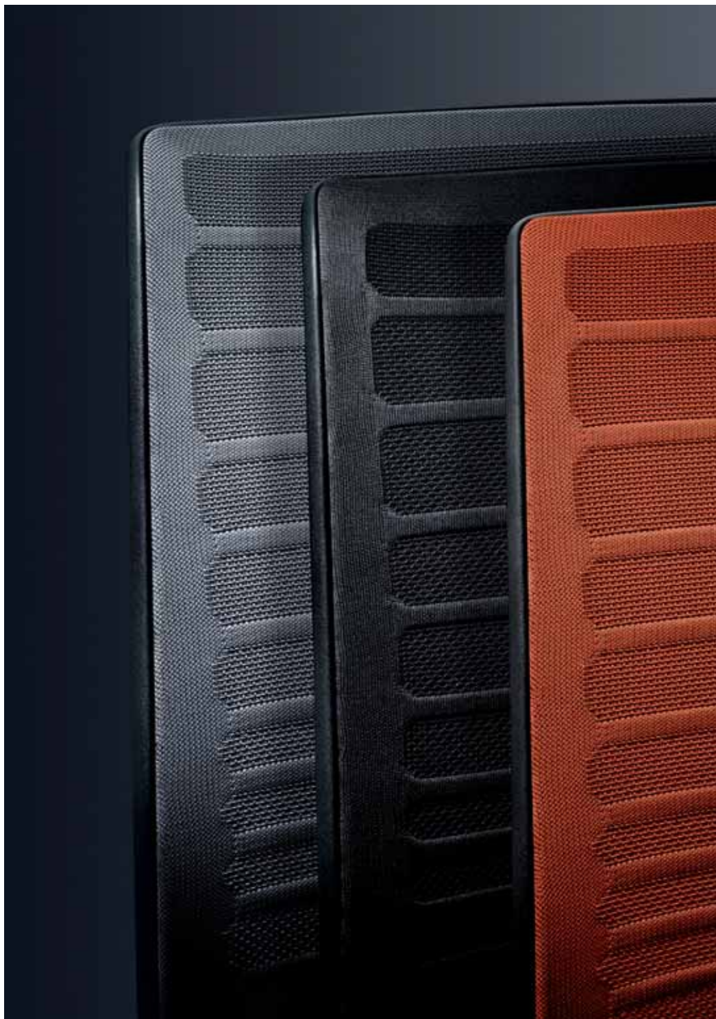
Die neuartige NetZRückenstruktur ist mit Streifenoptik transparent und opak. In den Farben Schwarz, Eisgrau und Orange

Autofit-Mechanik: Automatische Gewichtsregulierung mit Feinjustierung paßt die Beweglichkeit von Sitz- und Rückenlehne an das individuelle Körpergewicht an und ermöglicht eine ideale Sitzposition und ein gutes Gefühl