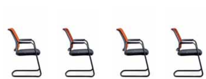
550H Freischwinger Rücken gepolstert, stapelbar 570H Freischwinger Rücken netzbespannt, stapelbar 555H Freischwinger Rücken gepolstert 575H Freischwinger Rücken netzbespannt