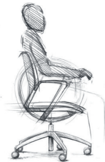
Skizzen Illustrations: Paolo Fancelli

La Force et le Corps pour les Humans en mouvement. Un siège pivotant est synonyme de mouvement. Sa spécificité réside dans le pivotement et l'oscillation. La forme idéale pour le mouvement, c'est la boule. C'est le seul corps rotatif sans restriction qui conserve toujours une élégance absolue. Même lorsqu'une boule est usinée, réduite par découpage et évidage, la géométrie d'une boule demeure intacte et visible. C'est le cas aussi avec le giroflex 313. La géométrie stricte place l'être humain au centre. Le giroflex 313 est présent, pas dominant. Il est dédié à sa fonction.