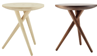
Esche / Ash