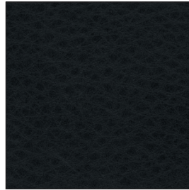
20.33 midnight black