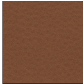
20.58 saddle brown