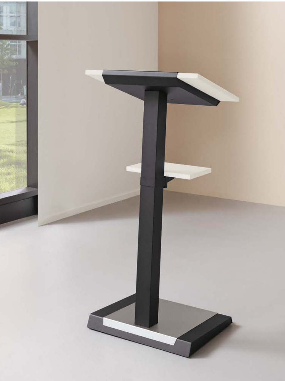
Stehpult feste Höhe mit Ablage/ohne Sichtblende | Speaker's desk fixed height with tray/without screen | Vaste hoogte van het bureau met afleg/zonder zichtsot

D ORGA-PLUS bietet für Workshops, Schulungen und Seminare zwei Plattformen für Ihren Vortrag. Egal ob als feste Höhe oder höhenstellbar über eine Gasfeder, bleiben Sie mit unserem Stehpult im Gespräch.