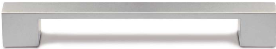
Steggriff | web-handle | bruggreep 1

Raster 160 mm | 160 mm spacing | raster 160 mm