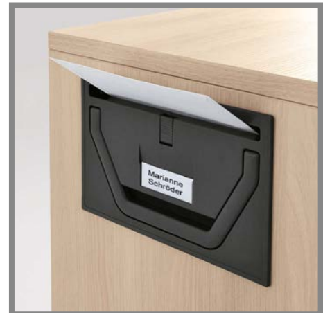
Funktionsbeschlag mit Griff und Briefschlitz | Functional fitting with handle and letter slot | Greep met brievenbus functie

N Met hun uiteenlopende inrichtingscomponenten dienen de mobiele containers van PALMBERG als flexibel in te zetten opbergcapaciteit. Ze bieden optimaal gebruik voor, schrijfwaren, ordners, persoonlijke documenten en voor brievenbus input.