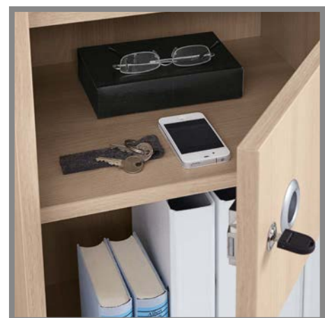
verschießbares Wertfach | lockable valuables compartment | afsluitbaar kluisje