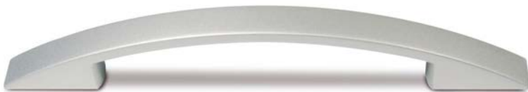
Bogengriff | bow-handle | booggreep

Raster 160 mm | 160 mm spacing | raster 160 mm