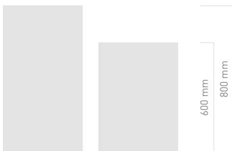
Tiefe | depth | diep

N Rolblokken vergemakkelijken uw dagelijkse werkzaamheden aanzienlijk. Door middel van een praktische ladeninrichting, verschillende hoogten en dieptes en tevens hun mobiliteit, zijn ze optimaal geschikt voor het ordenen, opbergen en structureren van allerhande behoeften.