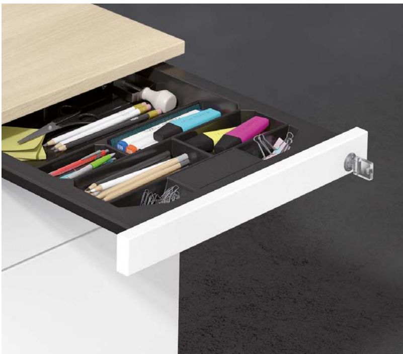
Container wahlweise mit abschließbarem Materialschub für Kleinteile | Container optionally with lockable material drawer for small parts | Container optioneel met afsluitbare materiaallade voor kleine onderdelen