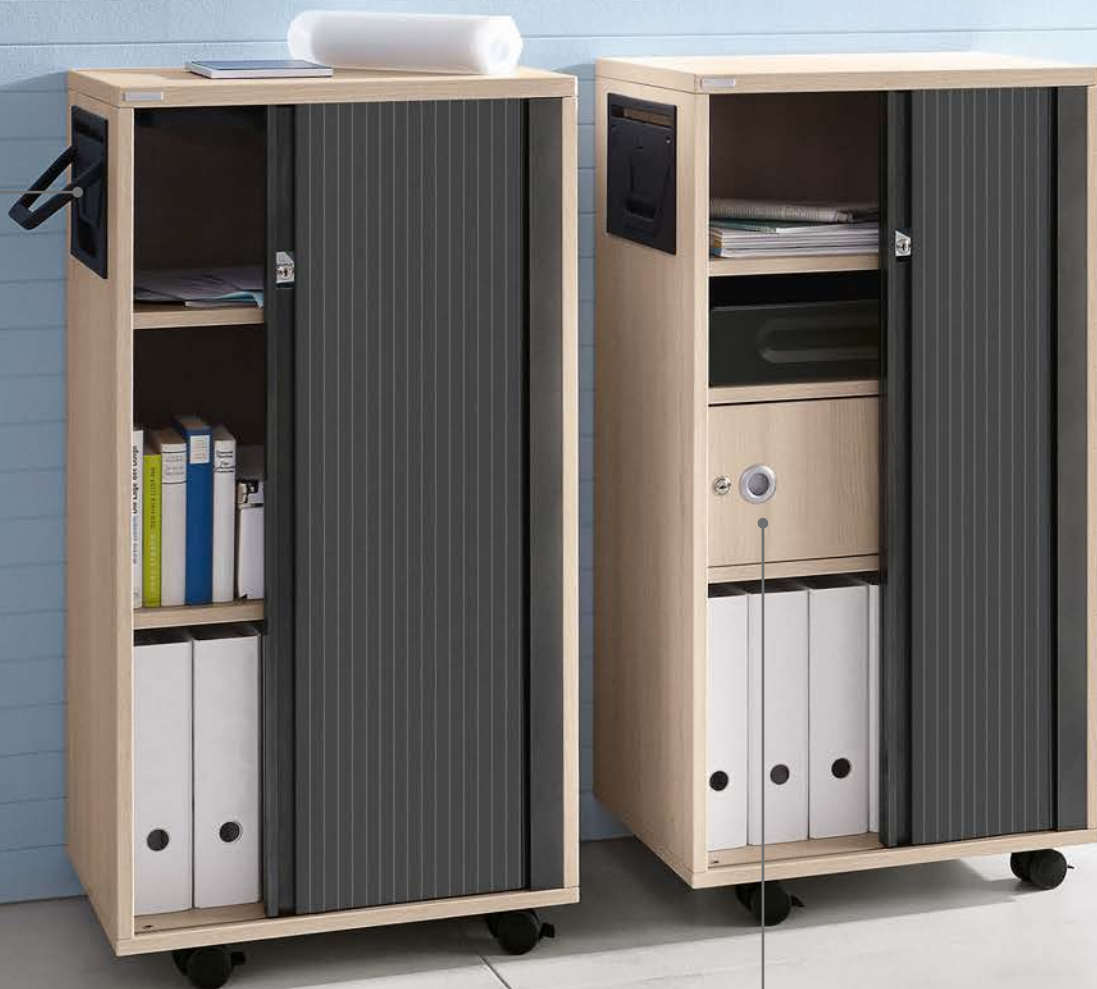
Mobilcontainer in Akazie | Mobile container in Acacia | Mobiele container in Acacia